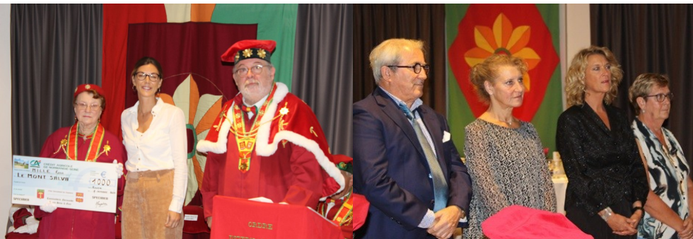
Le Mont Salva