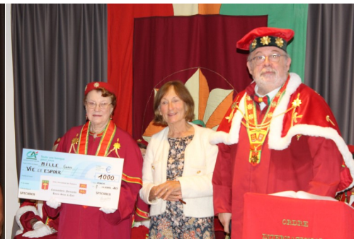
Vie et Espoir

Notre partenaire historique, La Bertelière, nous proposait un dîner dansant reconnu de qualité par l'ensemble des convives. Pour pouvoir remettre ces Dons lors du Chapitre, nous avons anticipé votre générosité habituelle pour notre souscription. Chaque billet acheté donne droit à un lot et le grand moment est la remise